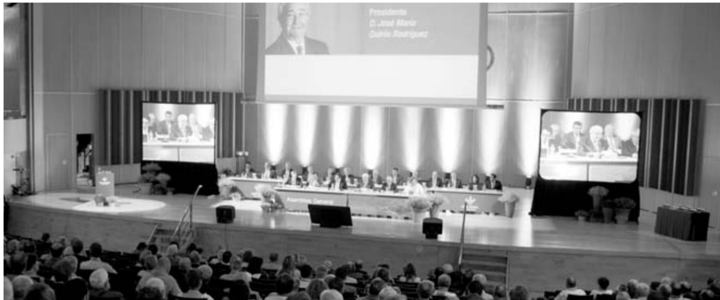
Vista general de la Asamblea celebrada en el Auditorio Príncipe Felipe de Oviedo.

La Asamblea General de socios aprueba las cuentas del ejercicio, la distribución de resultados y elige a sus representantes en el Consejo Rector de la entidad